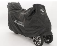
Plachta na skútr