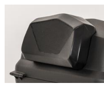
Opěrka pro 47l kufr