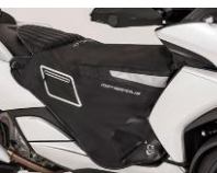
Plachta na nohy