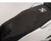
Potah na sedlo