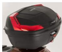
47l kufr černý