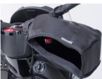
Návleky na ruce